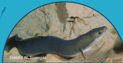
Garold W. Sneegas