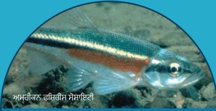
ਅਮਰੀਕਨ ਫ਼ਿਸ਼ਰੀਸ ਸੋਸਾਇਟੀ